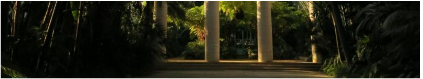
A l'intérieur. - Greisch/Ma2

Autre difficulté à résoudre, celle de la structure en acier. « L'acier se dilate en cas de forte chaleur mais on essaie de garder à peu près tout. Et puis, il y a les végétaux en dessous, qu'on devra préserver durant les travaux. C'est pourquoi on va travailler comme pour une pizza, par quartier, tout en protégeant les plantes. »